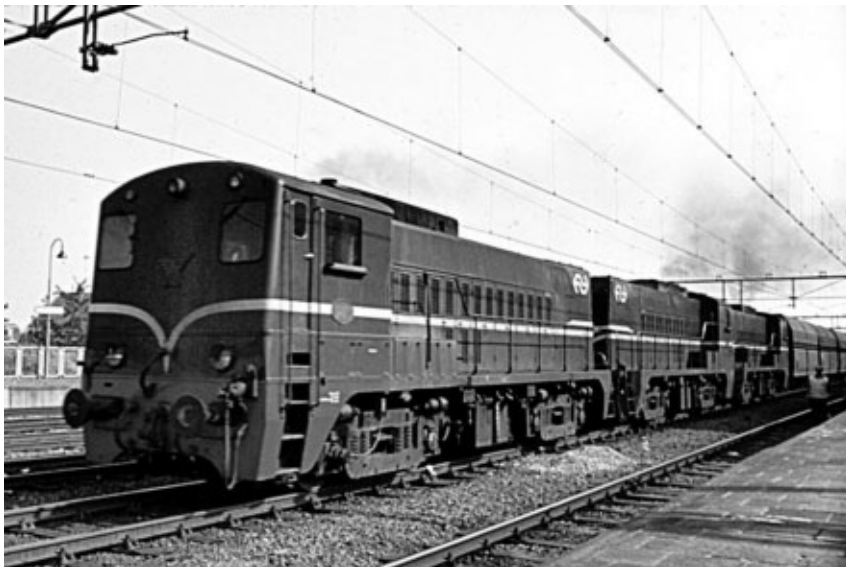
Driespan 2200'en met een ertstrein richting Amsterdam. Deze ertstreinen reden aanvankelijk met drie diesellocs. Om mee te kunnen komen met het intensievere treinverkeer werd er later een vierde loc aan toegevoegd.

na binnenkomst onmiddellijk tegen de goederentrein op spoor 6a en trekt zich weer op spoor 6b terug, zodat de 2400 aangekoppeld kan worden. Om 04.10 uur moeten het koppelen en de remproef achter de rug zijn, want dan moet deze goederentrein naar Lunetten vertrekken.